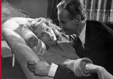
CHEMIE UND LIEBE (SBZ (DDR) 1948)