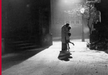
STRASSENBEKANNTSCHAFT (SBZ (DDR) 1948)