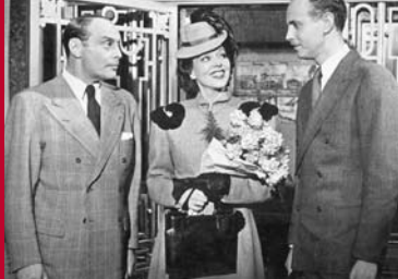
DIE NACHT IN VENEDIG (DE 1941/42)