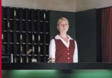
HOTEL (AT / DE 2004)