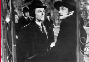
AM ABEND NACH DER OPER (DE 1944)