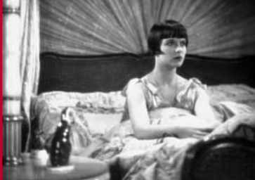
TAGEBUCH EINER VERLORENEN (DE 1929)