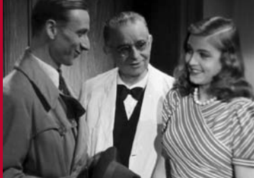
DER GLÜCKSGROSCHEN (DE 1943)