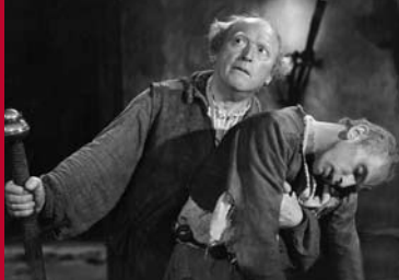
PARACELTUS (DE 1943)