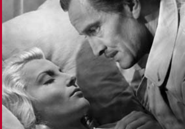
DER VERZAUBERTE TAG (DE 1944)