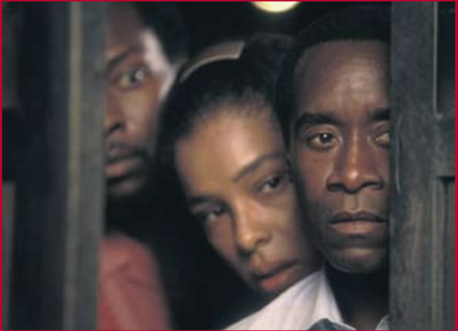
HOTEL RUANDA (Südafrika / GB / IT 2004)

Murnaustraße 6 | 65189 Wiesbaden | gegenüber Kulturzentrum Schlachthof