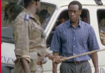
HOTEL RUANDA (Südafrika / GB / IT 2004)