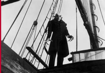
NOSFERATU (DE 1921)