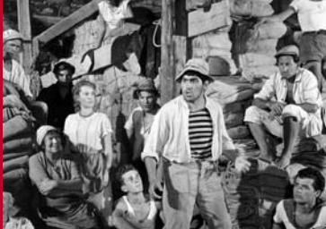
HARTE MÄNNER - HEISSE LIEBE (BRD / IT / Yu 1956)