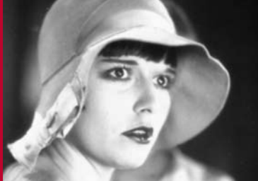
TAGEBUCH EINER VERLORENEN (DE 1929)