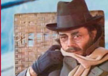
TOD IN VENEDIG (IT 1970)