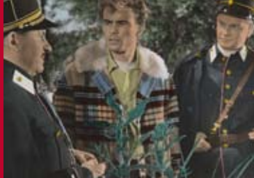
DAS TOTENSCHIFF (BRD / Mexico 1959)