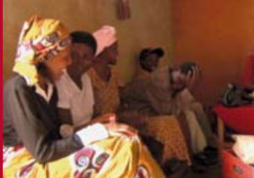
MY GLOBE IS BROKEN IN RWANDA (Ruanda / DE 2010)